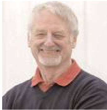
SIR JOHN WHITMORE

El directivo-Coach: Habilidades para la conversación de coaching. El modelo GROW